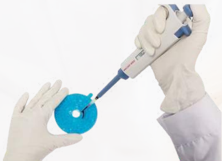
1.- Agregar muestra y diluyente

Resultados completos con 3 simples pasos en aproximadamente 12 minutos desde la adición de sangre completa hasta la impresión de resultados, lo que le ayuda a obtener rápidamente valores de Química completos y precisos, reduciendo el tiempo de espera del paciente y mejorando la satisfacción del Cliente.