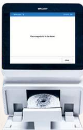
2.- Inserte el disco