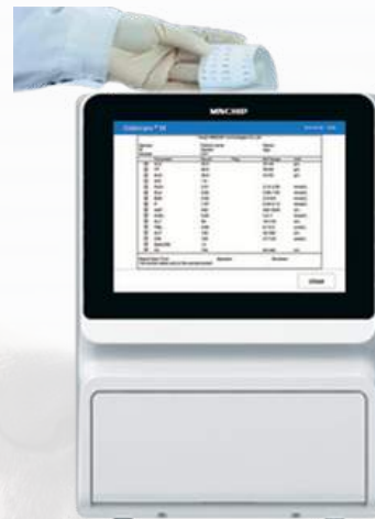
3.- Lea los resultados