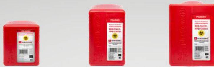
Recipientes de RPBI

Recipientes que cumplen con las características para identificar, contener y almacenar temporalmente los residuos peligrosos punzocortantes biológico infecciosos.